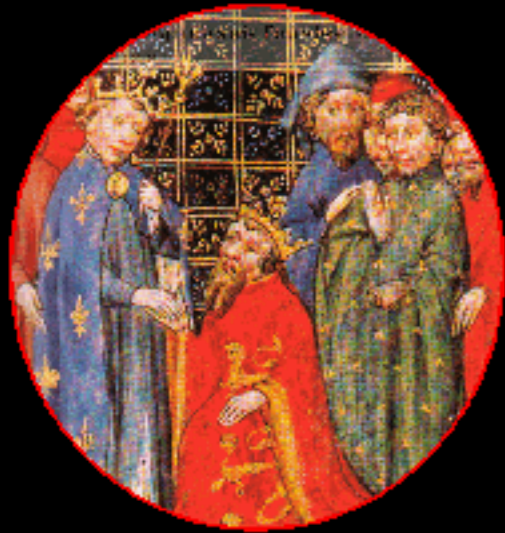
Hommage du prince de Galles au roi de France Philippe IV le Bel en 1304 pour le duché de Guyenne

Enfin, cher Seigneur, si je tenais de votre foi* plus que je ne m'en suis avisé à ce jour, je vous demande et prie qu'il vous plaise de m'en prévenir et je ferai mon devoir en plus des choses dites ci dessus, de même que si je m'en avisais par moi-même ou si d'autres m'en avertissaient, je me permettrais de vous le faire savoir et ferais mon devoir au plus tôt que je le pourrais.