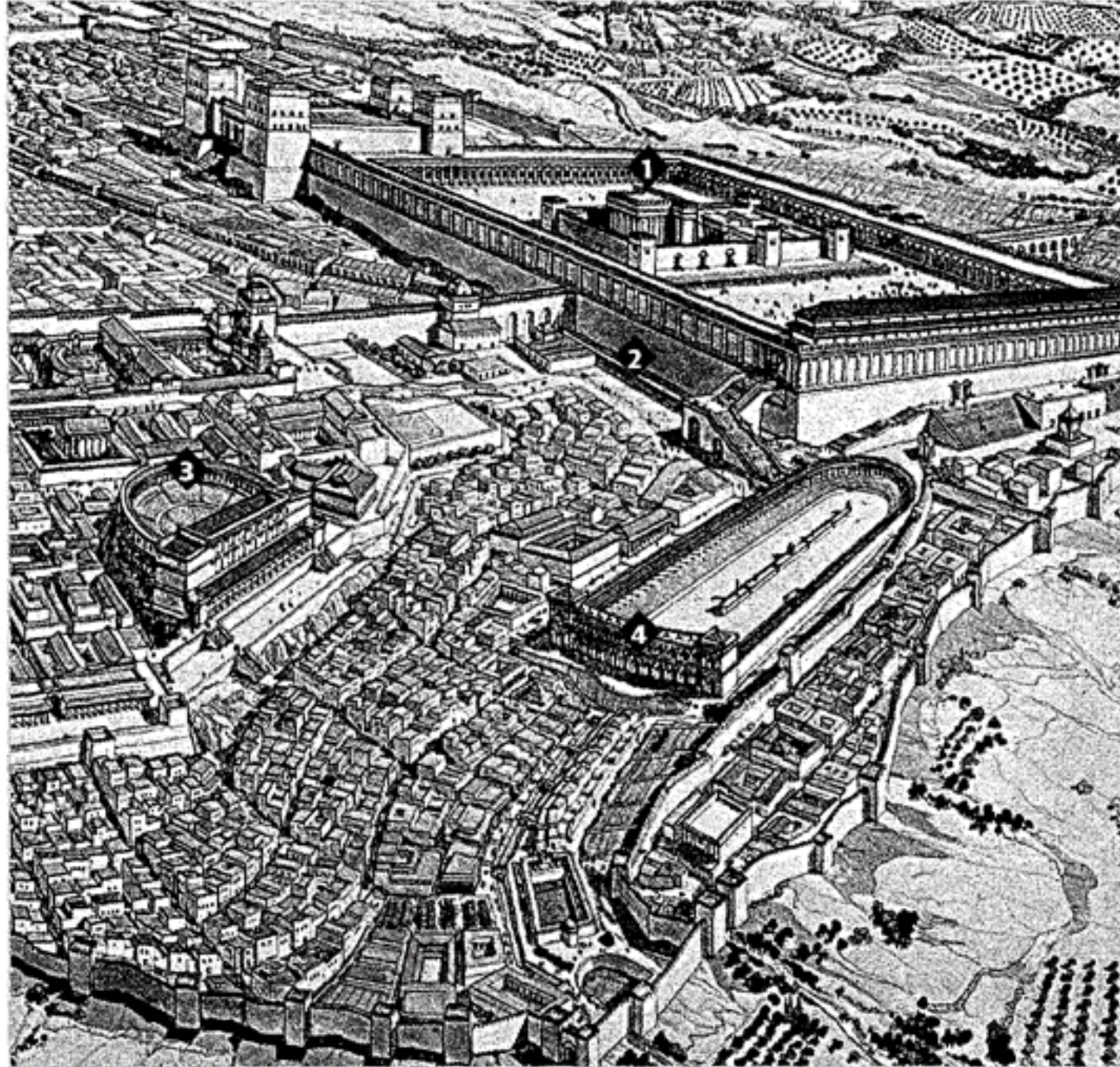
Jérusalem au I er siècle (reconstitution partielle): (1) Temple; (2) actuel Mur des Lamentations; (3) Théâtre; (4) Cirque.